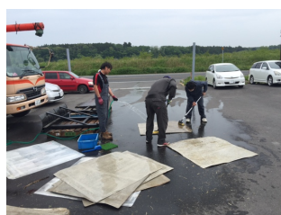
東北支店大そうじ